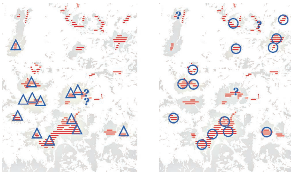
Rys. 2. Rozmieszczenie terytoriów dzięciołów: trójpalczastego (trójkąty) i białogrzbietego (kółka) w centralnej części Beskidu Wyspowego na tle występowania lasów starszych niż 80 lat (zakreskowany obszar). Szare pola – lasy, ? – terytoria niepotwierdzone Fig. 2. Distribution of territories of the Three-toed (triangles) and White-backed Woodpecker (circles) in the central part of the Beskid Wyspowy Mts. against the occurrence of older forests (more than 80-years-old, dashed area). Grey areas – forests, ? – unconfirmed territories

świerkowo-liściastych (8%) (rys. 3). Dzięcioł ten miał w starszych świerczynach (górnoregłowych i bagiennych) 4–5-krotnie wyższe zagęszczenia niż w borach mieszanych i aż 10-krotnie wyższe niż w gospodarczych borach świerkowych (rys. 3). Zdecydowaną większość terytoriów (70%) stwierdzono na terenie lasów państwowych w drzewostanach gospodarczych. Jedynie 2 terytoria (ok. 15%) znajdowały się na terenach chronionych. Proporcjonalnie do powierzchni drzewostanów najmniej terytoriów znaleziono w prywatnych borach (15%) (tab. 1).